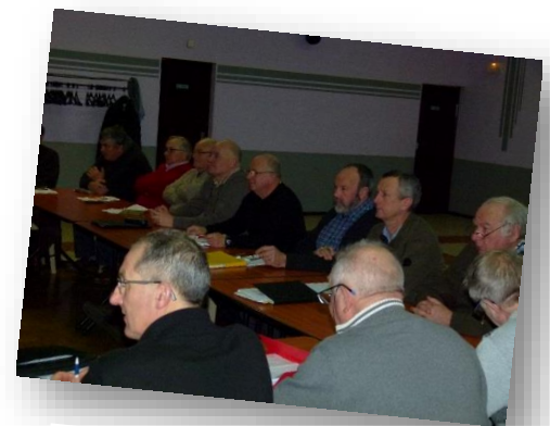
Lors de la présentation des enjeux identifiés par les services de l'Etat.

Il expose un projet politique adapté et répondant aux besoins et enjeux du territoire intercommunal, et aux outils mobilisables par la collectivité.